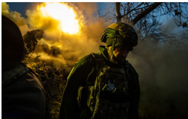
Фото: росіяни змінили тактику під Харковом і тиснуть на Покровськ

Російські війська продовжують наступальні дії одразу на кількох напрямках, намагаючись створити "буферні зони" та просунутися вглиб України. На Харківщині окупанти використовують нову тактику.