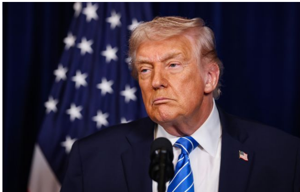
Фото: президент США Дональд Трамп (Getty Images)

Чоловік, який увірвався на вечерю лідерів США в готель Washington Hilton та відкрив вогонь, мав антихристиянський маніфест, повідомив американський лідер Дональд Трамп.