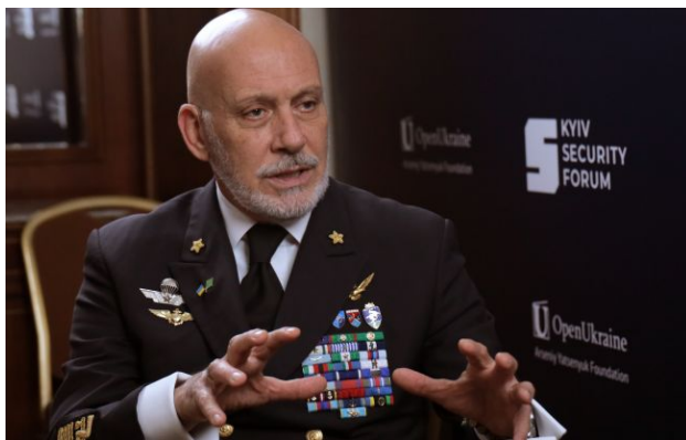
Фото: голова Військового комітету НАТО адмірал Джузеппе Каво Драгоне ((Блад Нестеров, РБК-Україна)

У НАТО назвали Росію загрозою номер один і попередили: Кремль планує повернути контроль над землями, якими він володів до розпаду Радянського Союзу.