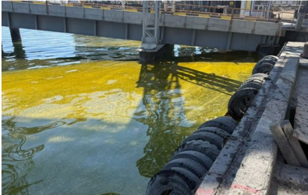
Фото: через удари РФ у порту Одещини вилились тисячі тон олії (t.me/derzhecoinspekciya_pivdenno_zah)

Після російського обстрілу Чорноморську в акваторії порту стався розлив соняшникової олії, у морі помітили величезну пляму.