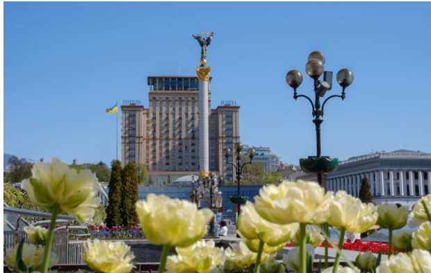
Потепління в Україні - бути

Після дощів і штормових поривів вітру в Україну повертаються заморозки. Проте холод не вічний - синоптики вже бачать тенденції до покращення ситуації та потепління.