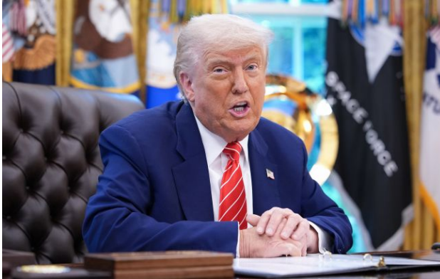
Фото: Дональд Трамп (Getty Images)

Президент США Дональд Трамп і його команда з нацбезпеки скептично поставилися до нової мирної пропозиції Ірану, що передбачає відкриття Ормузької протоки і відтермінування обговорень ядерної програми Тегерана.