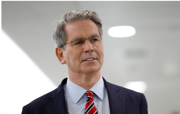
Фото: Скотт Бессент (Getty Images)

Глава Мінфіну США Скотт Бессент заявив, що Вашингтон може ввести санкції проти підприємств країн, які співпрацюють з іранськими авіакомпаніями.