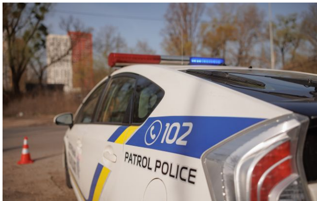
Фото ілюстративне: у Києві чоловік погрожував зброєю перехожим

У столиці поліцейські затримали чоловіка, який гуляв із пістолетом по вулиці та погрожував перехожим. Йому оголосили підозру.