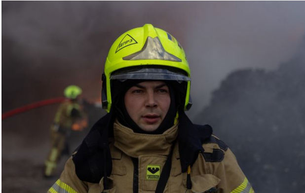
Росія атакувала чотири регіони 28 квітня

Вранці Росія завдала ударів по кількох регіонах України - постраждали Сумщина, Запоріжжя та Дніпропетровщина і не тільки. Ворожа атака триває.