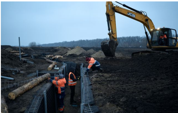
Фото: як Україна зміцнює північний кордон

Україна буде масштабу оборонну лінію вздовж північного кордону - від Київського водосховища аж до Сум. Мета - унеможливити будь-який новий наступ з боку Росії.