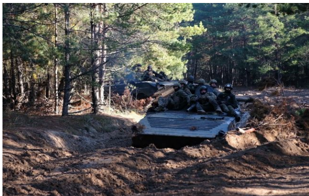
Фото ілюстративне: українські військові на фронті

Під прикриттям зеленої рослинності російські окупанти намагаються проникнути у Великомихайлівський ліс, щоб просунутися вглиб українських позицій у Дніпропетровській області.