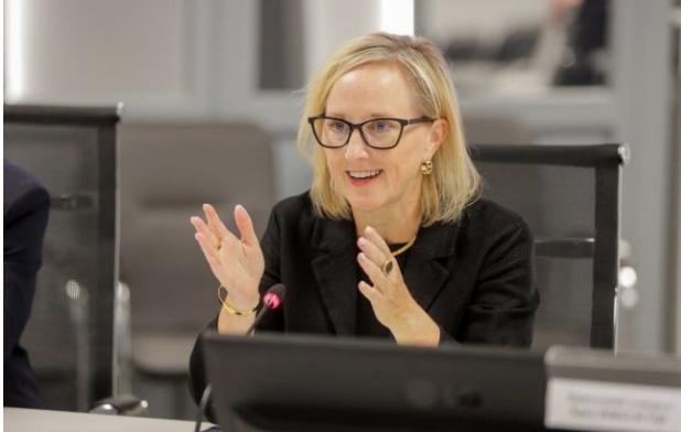
Фото: Джулі Девіс, тимчасова повірена у справах США в Україні (facebook.com/usdos.ukraine)

Тимчасова повірена у справах США в Україні Джулі Девіс покине свою посаду найближчими тижнями через розбіжності з американським лідером Дональдом Трампом.