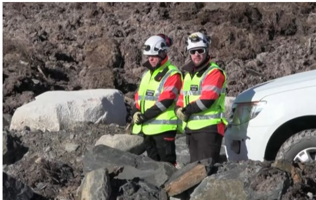
Фото: кар'єр Сювяярві з літієм (Скриншот)

Фінляндія відкрила першу в Європі шахту та завод з перероблювання літію. Проект вартістю 783 мільйони євро дозволить ЄС зменшити залежність від постачання із Китаю та Азії.