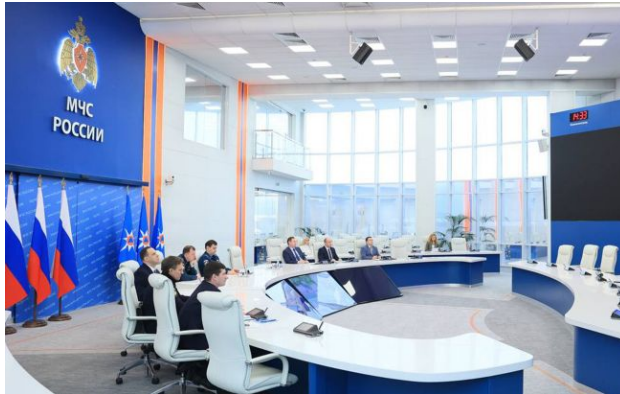
Фото: відмовлятися від режиму НП поки не планують (росЗМІ)

Розлив нафтопродуктів на НПЗ у російському Туапсе після атаки безпілотників вдалося зупинити, однак ліквідація наслідків триває. У місті запроваджено режим надзвичайної ситуації, понад 30 вулиць залишилися без водопостачання, існує ризик забруднення Чорного моря.