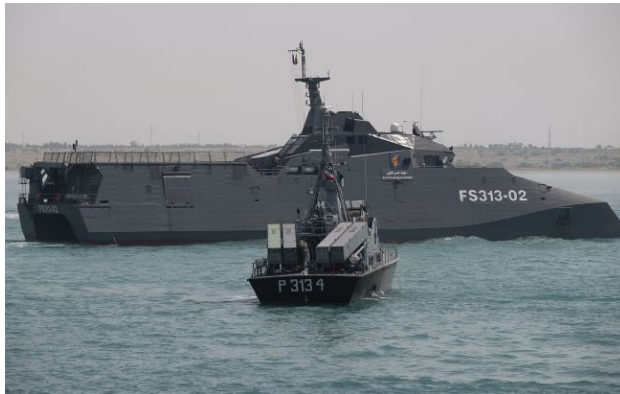
Фото: іранський флот (Getty Images)

Президент США Дональд Трамп наказав ВМС США готуватися до тривалої блокади Ормузької протоки. Вашингтон прагне максимально посилити економічний тиск на Тегеран, оскільки війна триває вже третій місяць.