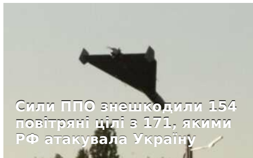
Сили ППО знешкодили 154 повітряні цілі з 171, якими РФ атакувала Україну