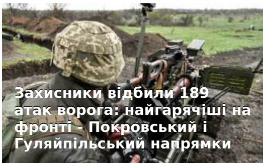
Захисники відбили 189 атак ворога: найгарячіші на фронті - Покровський і Гуляйпільський напрямки