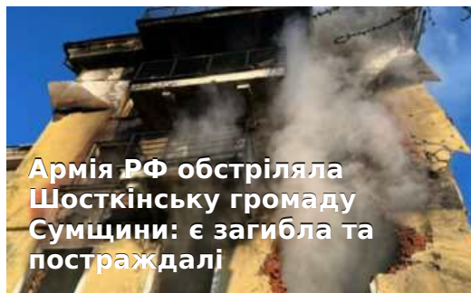
Армія РФ обстріляла Шосткінську громаду Сумщини: є загибла та постраждалі