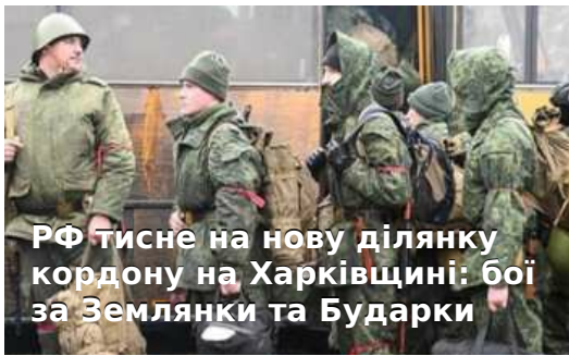
РФ тисне на нову ділянку кордону на Харківщині: бої за Землянки та Бударки