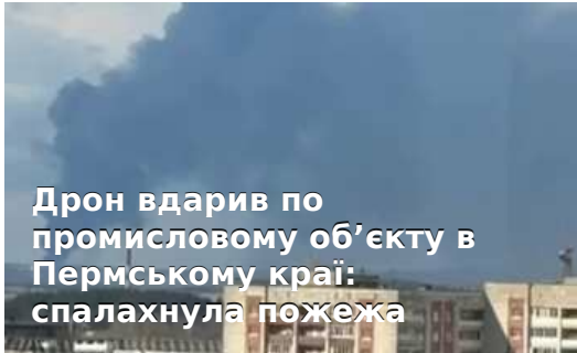
Дрон вдарив по промислому об'єкту в Пермському краї: спалахнула пожежа