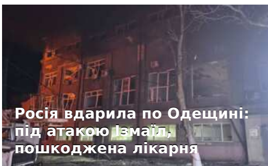
Росія вдарила по Одещині: під атакою Ізмаїл, пошкоджена лікарня