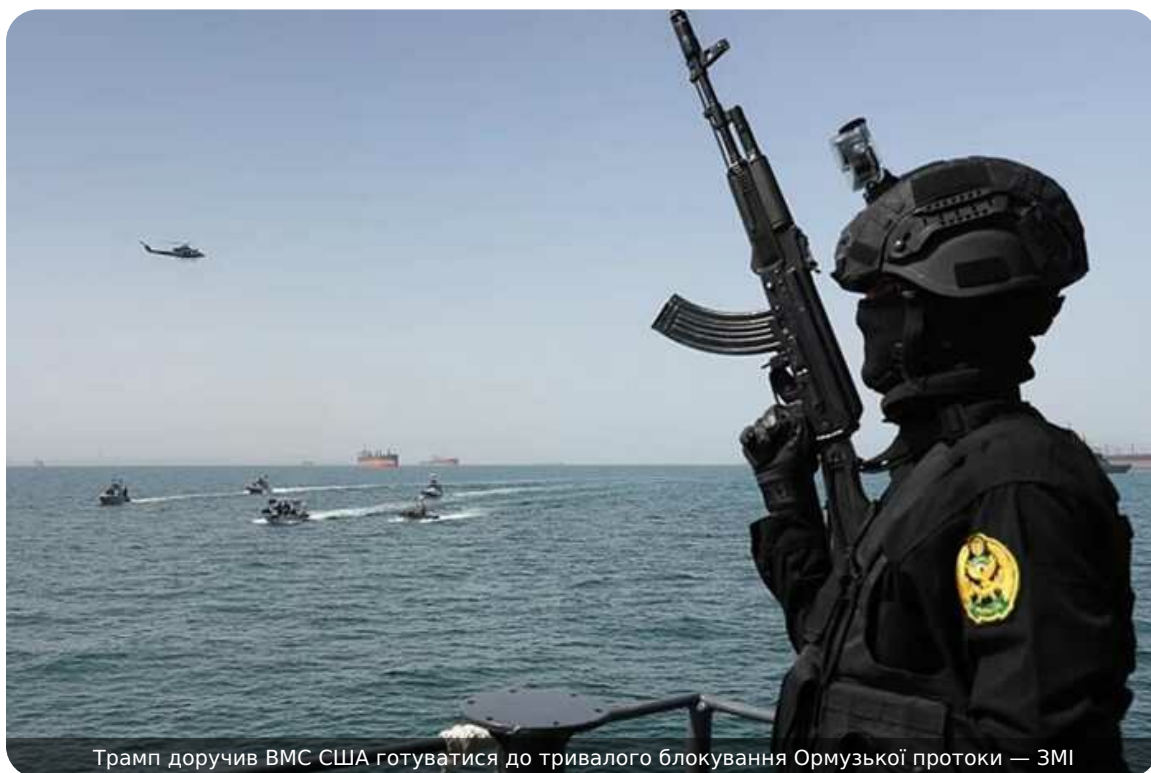
Трамп доручив ВМС США готуватися до тривалого блокування Ормузької протоки — ЗМІ

Президент США Дональд Трамп доручив ВМС США підготуватися до можливого довготривалого блокування Ормузької протоки. У Вашингтоні заявляють про намір посилити економічний тиск на Тегеран на тлі того, що бойові дії тривають уже третій місяць.