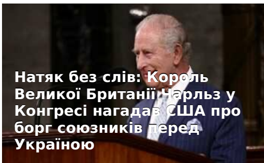
Натяк без слів: Король Великої Британії Чарльз у Конгресі нагадав США про борг союзників перед Україною