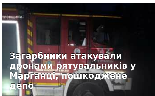
Загарбники атакували дронами рятувальників у Марганці, пошкоджене депо