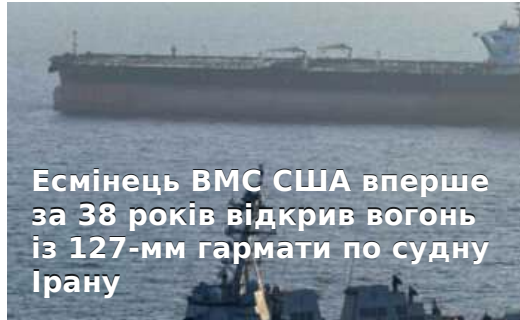
Есмінець ВМС США вперше за 38 років відкрив вогонь із 127-мм гармати по судну Ірану