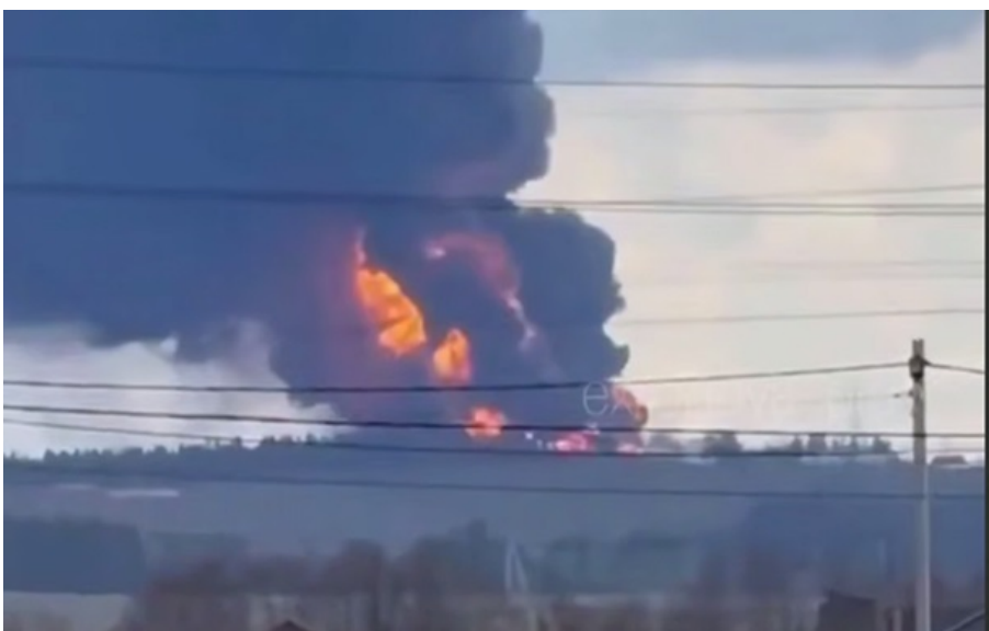
Фото: кадр з відео Пожежа на станції нафтопроводу Перм

Українські дрони, зокрема, вдарили по нафтоперекачувальній станції поблизу Пермі. На підприємстві вирує масштабна пожежа.