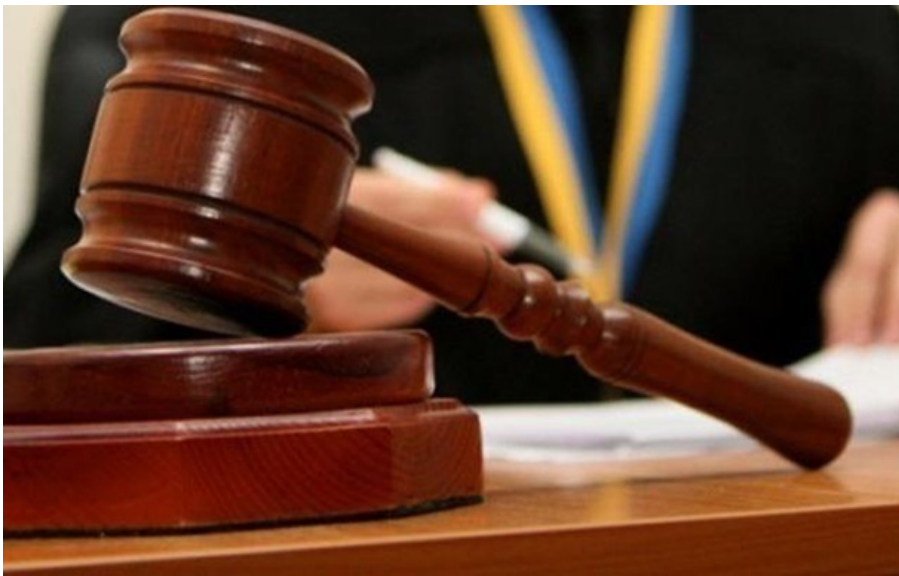
(ілюстративне фото)

Інформатор ФСБ отримав вісім років позбавлення волі