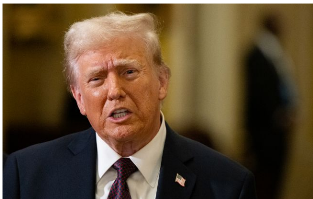
Фото: Дональд Трамп, президент США

Президент США Дональд Трамп розповів про результати своєї розмови із російським диктатором Володимиром Путіним. За його словами, РФ "ще давно" була готова до мирної угоди.