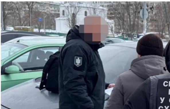
Судитимуть посадовця, який отримав хабар поштою

Посадовець запропонував колишньому підлеглому за гроші допомогти з переведенням до іншого підрозділу на Закарпатті.