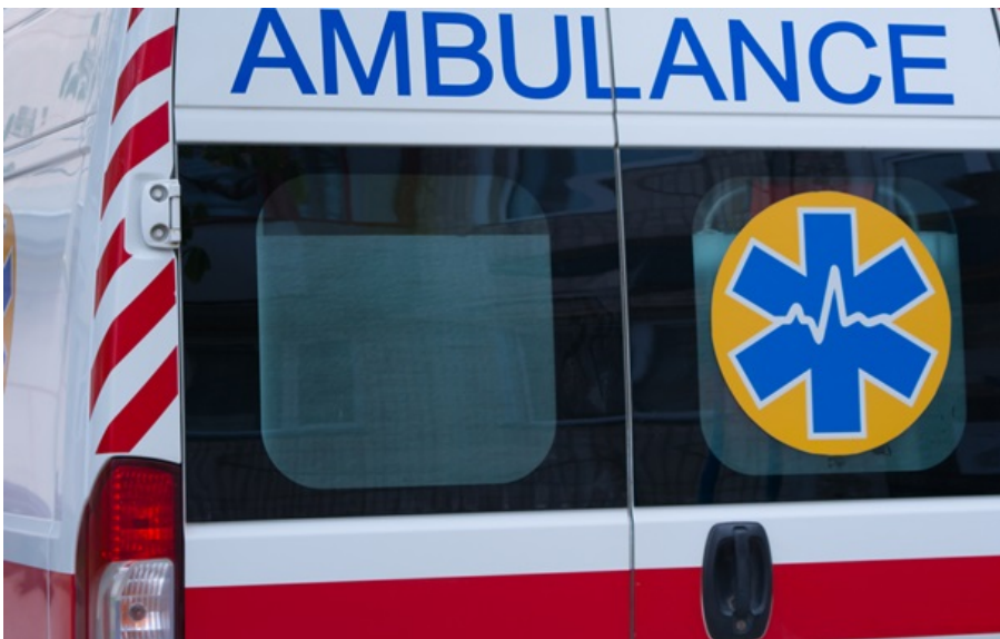
Відомо про трьох поранених

Попередньо, внаслідок ворожої атаки, постраждали троє осіб. Також зафіксували пошкодження прилеглих житлових будинків.