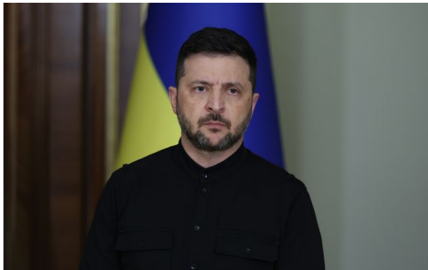
Фото: Володимир Зеленський (Getty Images)

Російський диктатор Володимир Путін може використати тему перемир'я для скасування деяких санкцій. Водночас жодних сигналів від РФ або США щодо переговорів Київ не отримував.