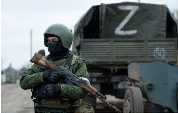
Фото: російські військові

Росія зможе підтримувати нинішню інтенсивність війни ще щонайменше рік-два, однак її можливості для масштабного наступу залишаються обмеженими.