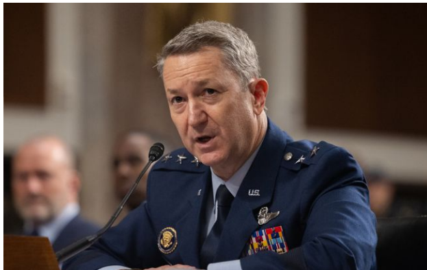
Фото: генерал Ден Кейн (Getty Images)

Росія допомагає Ірану у війні, що раніше заперечував Кремль. Про це стало відомо під час слухань у Сенаті.