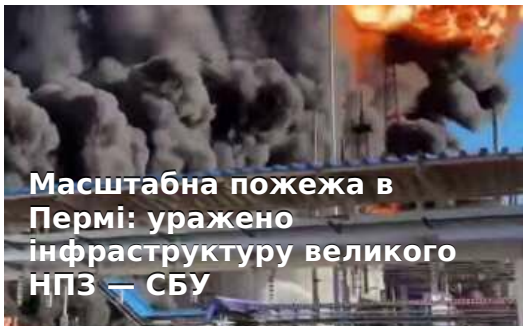
Масштабна пожежа в Пермі: уражено інфраструктуру великого НПЗ — СБУ