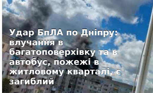
Удар БЛА по Дніпру: влучання в багатоповерхівку та в автобус, пожежі в житловому кварталі, є загиблій