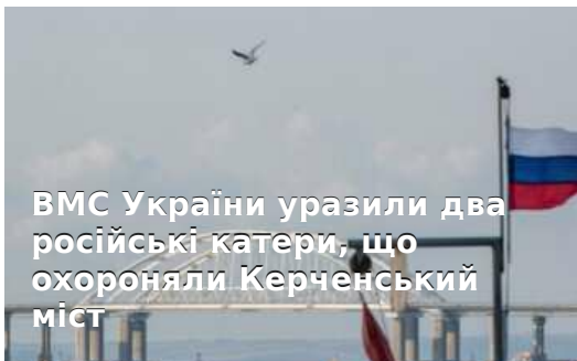
ВМС України уразили два російські катери, що охороняли Керченський міст