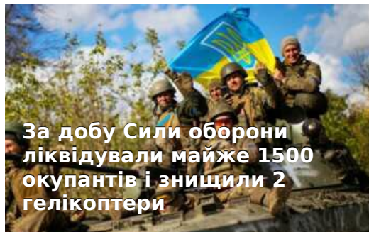
За добу Сили оборони ліквідували майже 1500 окупантів і знищили 2 гелікоптери