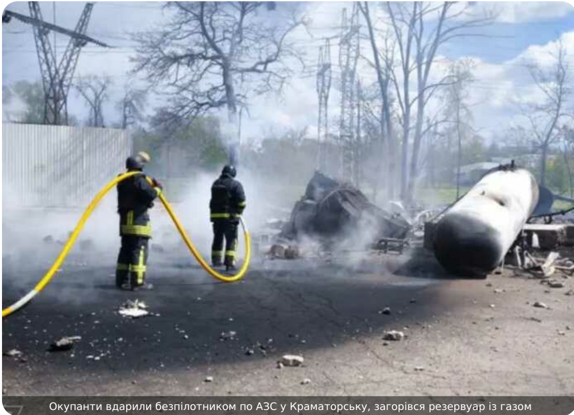
Окупанти вдарили безпілотником по АЗС у Краматорську, загорівся резервуар із газом

Сьогодні, 30 квітня, росіяни вдарили безпілотником по автозаправній станції в Краматорську Донецької області, спричинивши загоряння, зокрема, резервуару з газом.