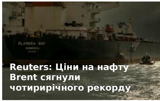
Reuters: Ціни на нафту Brent сягнули чотирирічного рекорду