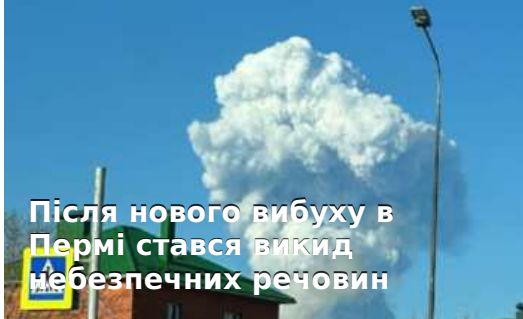
Після нового вибуху в Пермі стався викид небезпечних речовин