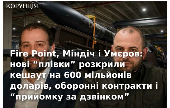
Fire Point, Міндіч і Умеров: нові "плівки" розкрили кешаут на 600 мільйонів доларів, оборонні контракти і "приймку за дзвінком"