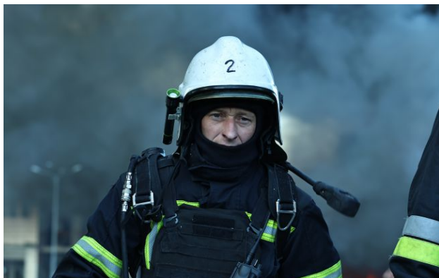
Фото: внаслідок удару РФ по Миколаєву виникла пожежа

Російські війська атакували Миколаїв за допомогою дронів. Унаслідок удару виникла пожежа, пошкоджено приватний сектор.