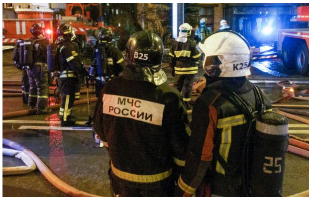
загроза атаки для регіону вже кілька годин

У ніч на 1 травня місто Туапсе в Росії знову зазнало атаки невідомих безпілотників. Причому це вже четверта за короткий період атака з наслідками.