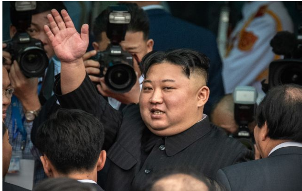
Фото: глава КНДР Кім Чен Ин

На відкритті величній бронзової скульптури північнокорейських та російських солдатів, які загинули на війні в Україні, глава КНДР похвалив тих військових, які не здались в полон та самоліквідувались.