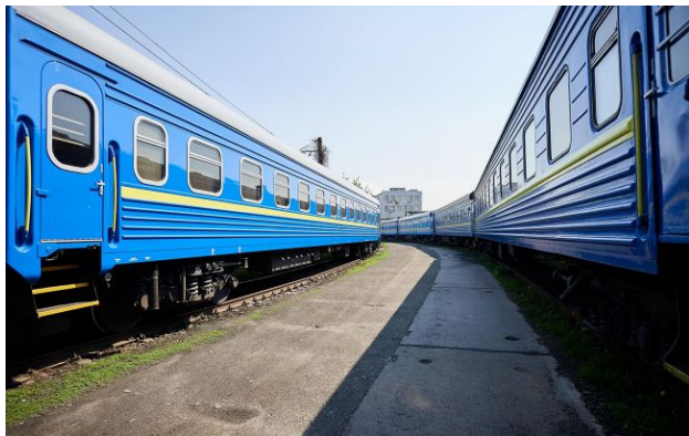
Фото ілюстративне: на Львівщині автокран врізався у поїзд

Вранці, 1 травня, у Львівській області автокран виїхав на колії попри увімкнену сигналізацію та зіткнувся з пасажирським поїздом. Через це загинув машиніст, який був ветераном.