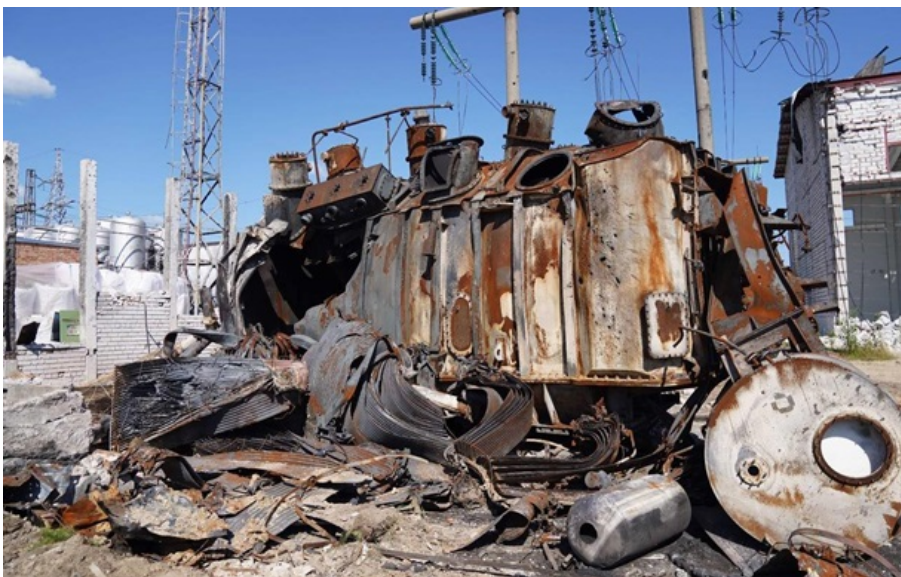
Пошкоджений енергетичний об'єкт (архівне фото)

Необхідність в ощадливому енергоспоживанні зберігається. Варто обмежити користування потужними електроприладами у вечірні години, попереджають енергетики.