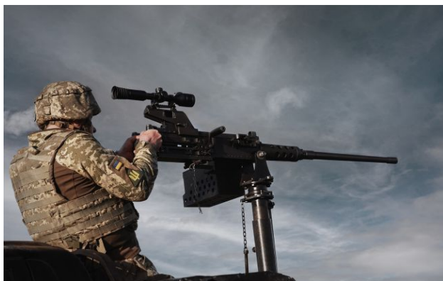
Фото: в регіонах України тривога через загрозу дронів

Росія від ранку атакує Україну групами ударних дронів. Нові групи безпілотників продовжують перетинати український кордон.