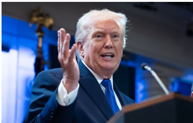
Фото: Дональд Трамп (Getty Images)

Заява президента США Дональда Трампа про можливе виведення частини американських військ із Німеччини приголомшила представників Пентагону. Вони задавалися питанням, чи дійсно він цього разу має намір виконати свої погрози.