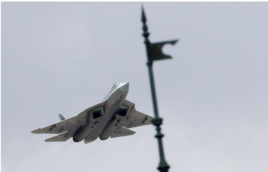
Су-57 летить над Кремлем

Важливі цілі знаходились на аеродромі Шагол у Челябінській області РФ на відстані близько 1700 км від держкордону України.