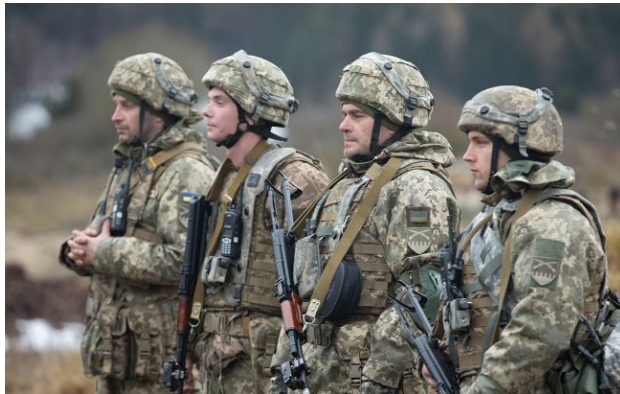
Фото: українська влада анонсувала реформу ЗСУ (facebook.com/GeneralStaff.ua)

Обирайте перевірене - додайте РБК-Україна до улюблених джерел у Google