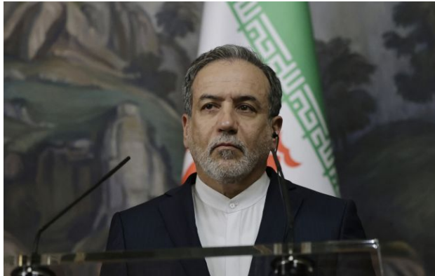
Фото: глава МЗС Ірану Аббас Аракчі

Обирайте перевірене - додайте РБК-Україна до улюблених джерел у Google