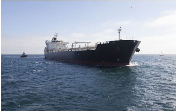
Фото: США перенаправили понад 40 суден, які хотіли прорватися через блокаду

Обирайте перевірене - додайте РБК-Україна до улюблених джерел у Google