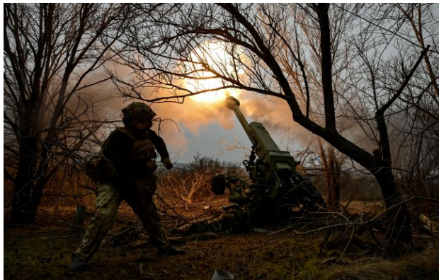
Фото: росіяни намагаються витіснити Сили оборони з північних околиць Покровська (Getty Images)

Обирайте перевірене - додайте РБК-Україна до улюблених джерел у Google