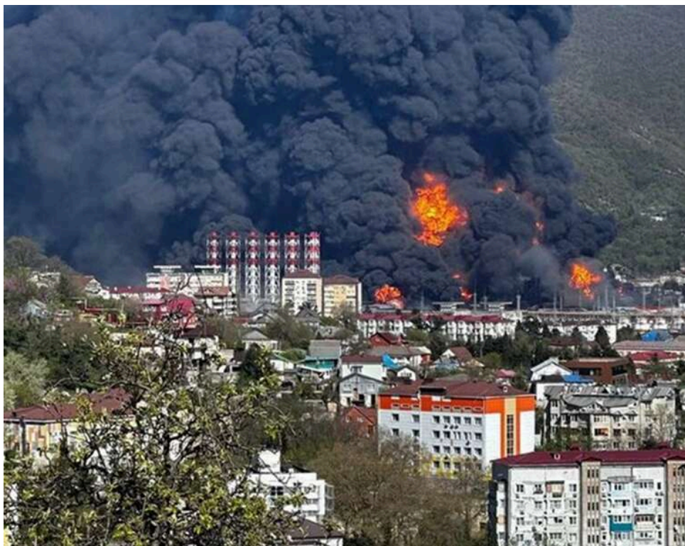
«Ефект доміно» не спрацював: чому удари по російських НПЗ поки що не підривають бюджет РФ

Ефект від ударів України по російській нафтовій галузі неоднозначний і обмежений, попри заяви Зеленського про значну шкоду для Росії. Про це повідомляє Associated Press.