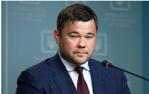
Фото: Андрій Богдан, экс-глава Офісу президента (Віталій Носач, РБК-Україна)

Обирайте перевірене - додайте РБК-Україна до улюблених джерел у Google