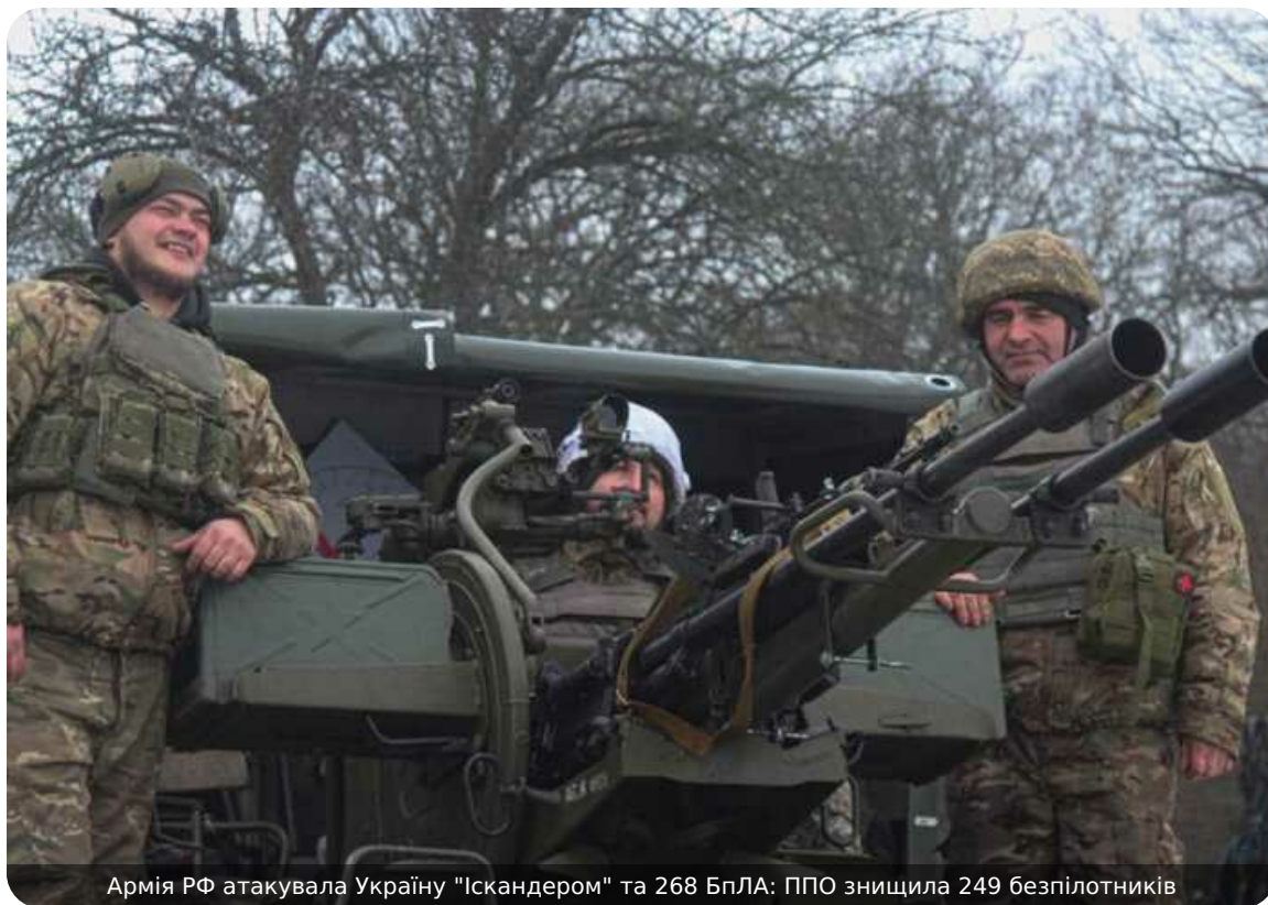
Армія РФ атакувала Україну "Іскандером" та 268 БпЛА: ППО знищила 249 безпілотників

У ніч на 3 травня 2026 року війська РФ атакували балістичною ракетою Іскандер-М із Курської обл., 268-ма ударними БпЛА типу Shahed (в т.ч. реактивними), Гербера, Італмас та безпілотниками інших типів, понад 160 із них - "шахеда".