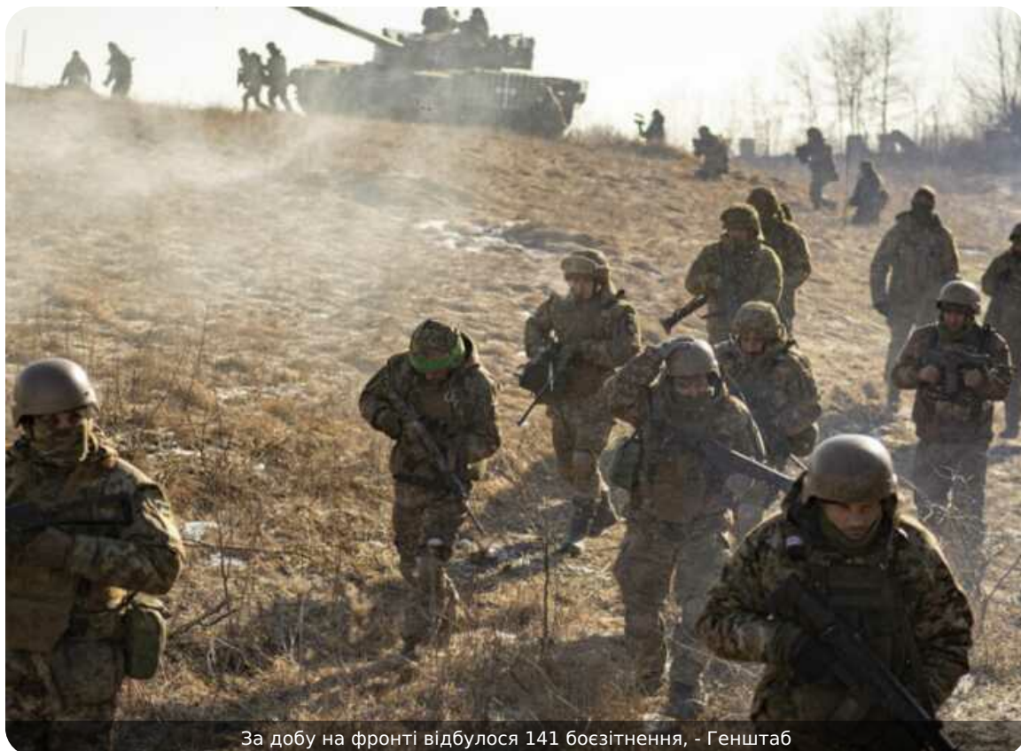
За добу на фронті відбулося 141 боєзітнення, - Генштаб

Розпочалася 1530-та доба широкомасштабної збройної агресії РФ проти України. Загалом протягом минулої доби зафіксовано 141 бойове зіткнення.