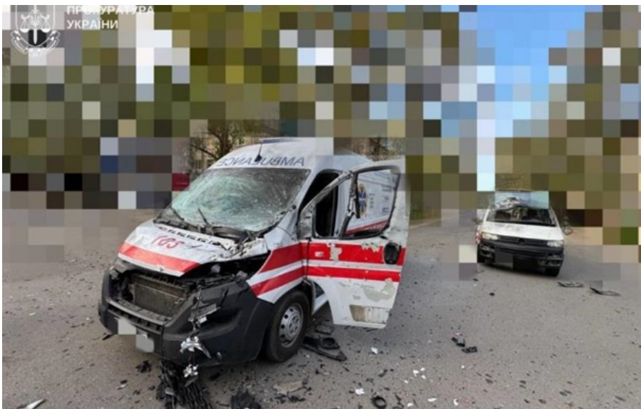
Під час повторної атаки пошкоджено карету швидкої медичного допомоги

Від отриманих травм на місці загинув 60-річний чоловік, ще п'ятеро людей - отримали травми різного ступеню.