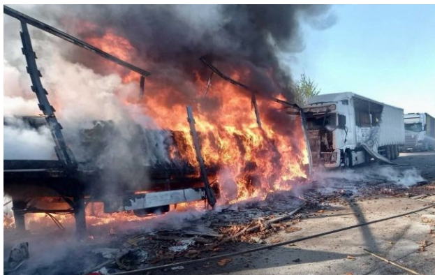
Фото: Росія ударила по АЗС і зачепила автобус з дітьми на Дніпропетровщині (t.me/dnipropetrovskaODA)

Обирайте перевірене - додайте РБК-Україна до улюблених джерел у Google