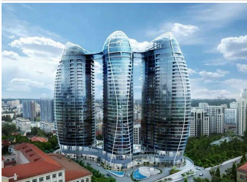
Элитные квартиры в Taryan Towers активно скупают неимущие пенсионеры: мошенничество и схема легализации теневых миллионов?

Пока Украина живет в условиях войны, экономии и постоянных сборов на армию, в центре столицы продолжают сделки на сотни тысяч долларов. В одном из самых дорогих жилых комплексов страны – Taryan Towers – квартиры покупают люди, чьи официальные доходы не позволяют приблизиться к таким суммам даже теоретически.