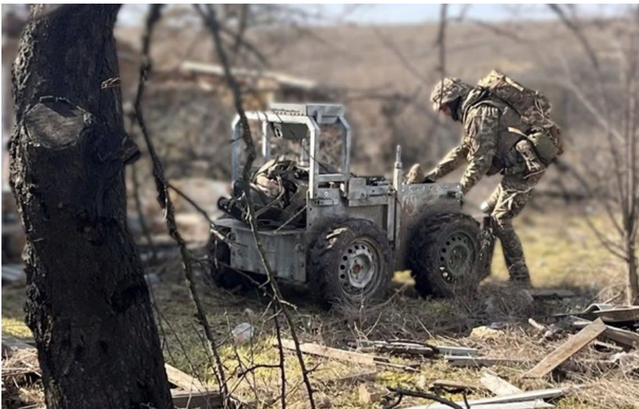
Збройні сили України продовжують чинити опір російській агресії

Більш ніж половину з цих атак російські окупанти здійснили на Покровському та Костянтинівському напрямках.