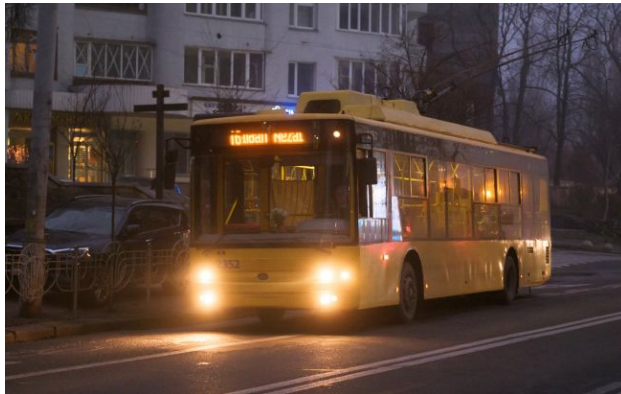
Фото: громадський транспорт

Обирайте перевірене - додайте РБК-Україна до улюблених джерел у Google