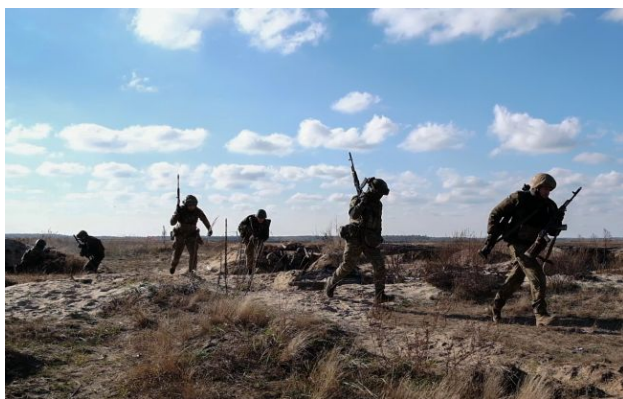
Фото: українські військові на фронті (Віталій Носач, РБК-Україна)

Обирайте перевірене - додайте РБК-Україна до улюблених джерел у Google