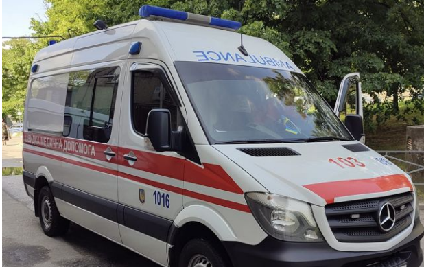
Фото: Четверо загиблих і десятки постраждалих: що трапилось у Мерефі вранці (facebook.com/AMBULANCEZP)

Обирайте перевірене - додайте РБК-Україна до улюблених джерел у Google