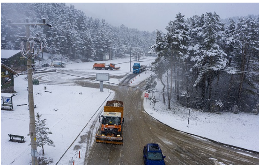
Снігопад зупинив рух вантажівок на дорогах Туреччини

У центральній частині країни місили закрити дороги державного значення для вантажівок.