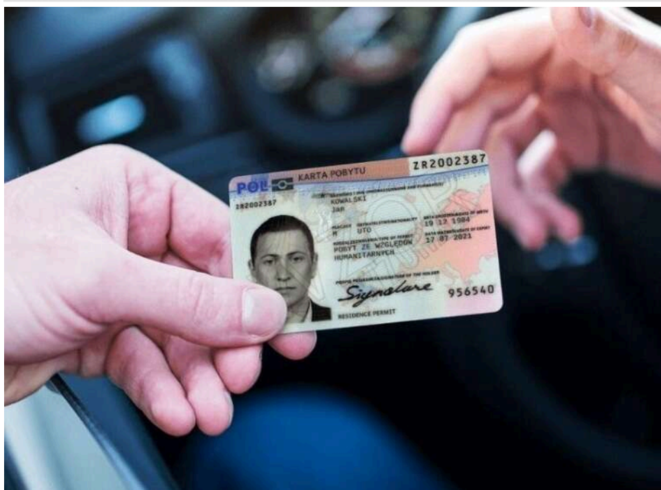
Українці в Польщі з PESEL UKR можуть подати на 3-річну карту побиту CUKR онлайн

Відсьогодні громадяни України – власники PESEL UKR – можуть подати заяву на трірічну Карту побиту CUKR.